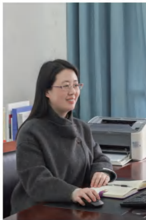
教师：心中有爱 铸魂育人