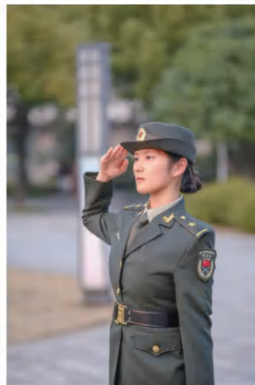
大学生教官：操练促我成长