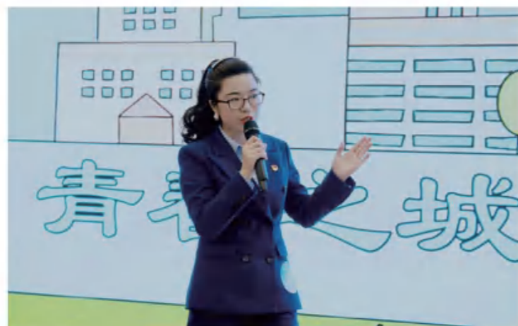
团干部：我为青春代言