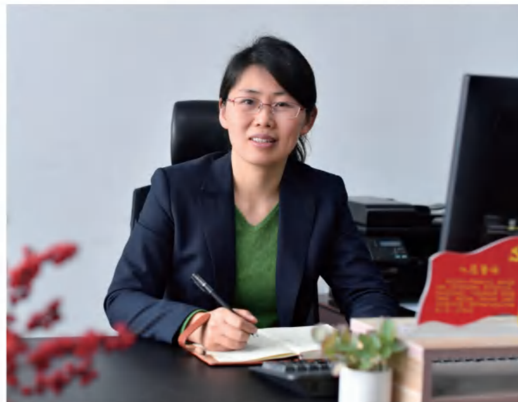
机关党委书记：尽心尽职助力企业发展