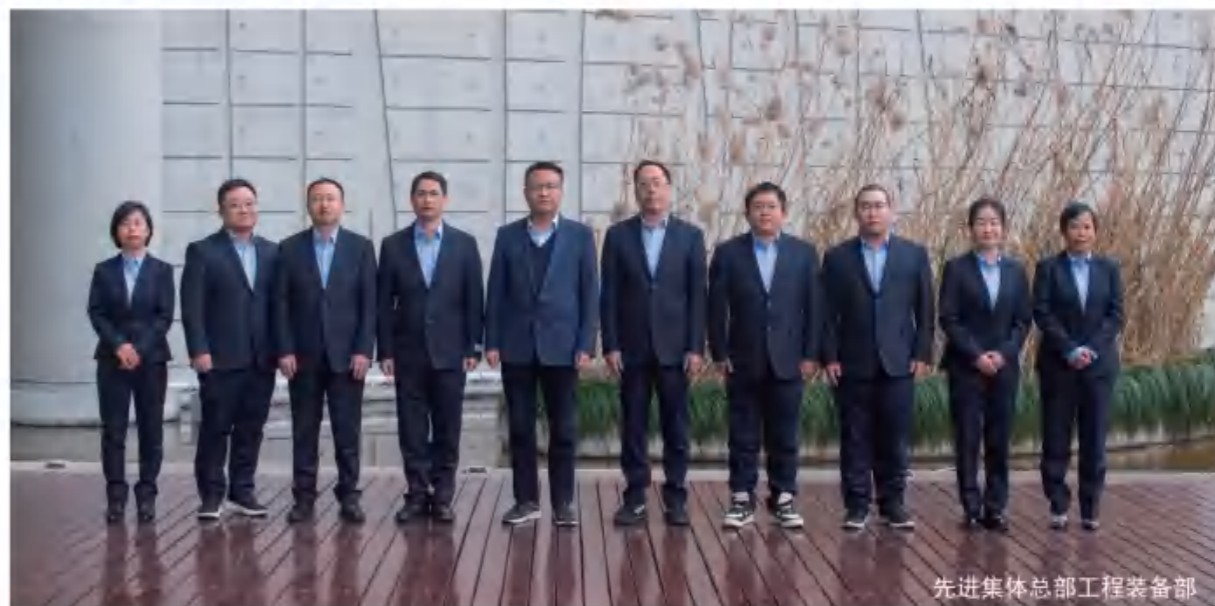
先进集体总部工程装备部

这一年，公司秉持“规范高效”管理理念，扎实推进管理提升工作。标准化车间建设取得成效，现场5S管理持续改善。数智化转型持续推进，自控操作频次大幅降低，智能工厂三期上线稳定