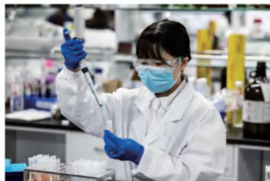
实验人员：认真是一种态度