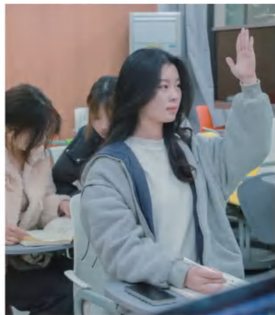
大学生：课堂积极举手定格瞬间