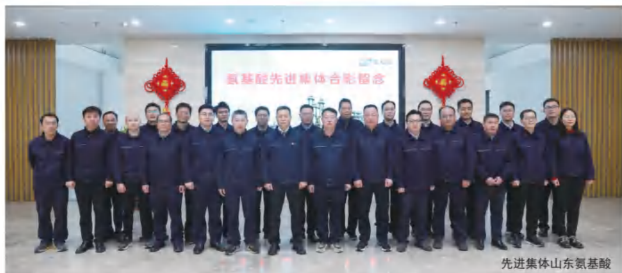
先进集体山东氨基酸