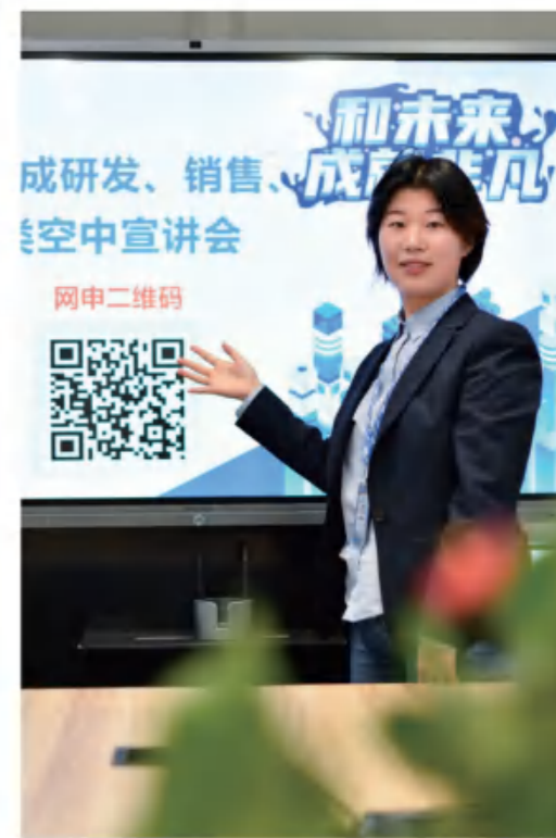
招聘专员：让每一场宣讲会“声”入人心