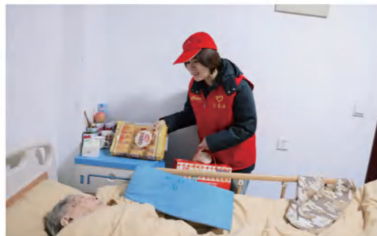
志愿者：爱人者人恒爱之