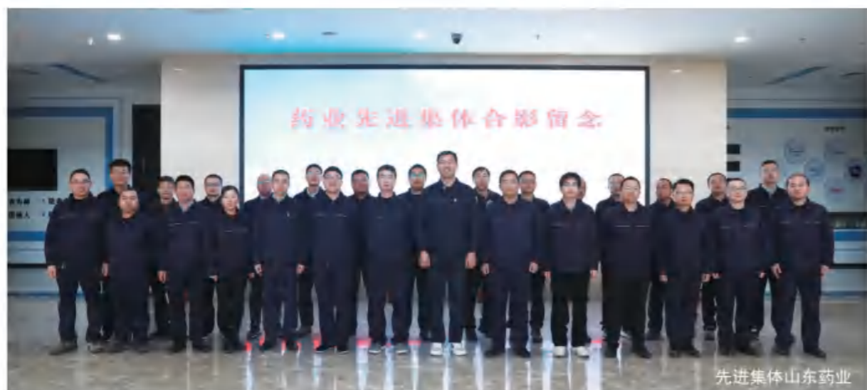
先进集体山东药业

大道固远，笃行可至。2024年，在总公司的领导下，山东药业全体干部员工将携手同心、砥砺前行，朝着“国际一流的香精香料品牌公司”的目标稳步前行，为实现“世界新和成”的伟大梦想而努力奋斗！